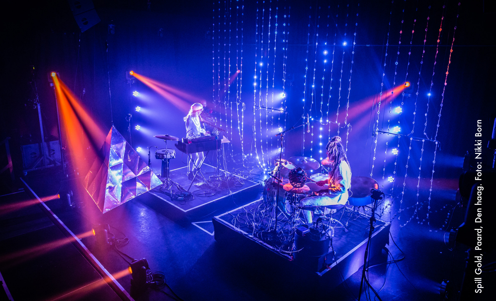
Spill Gold, Paard, Den Haag.